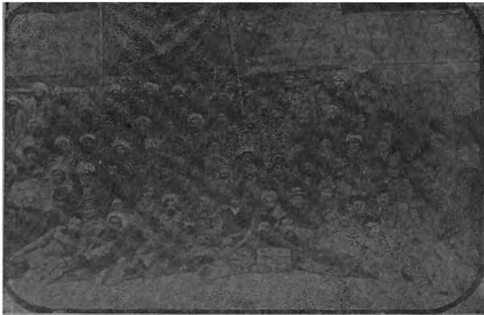
Кокандское автономное правительство.