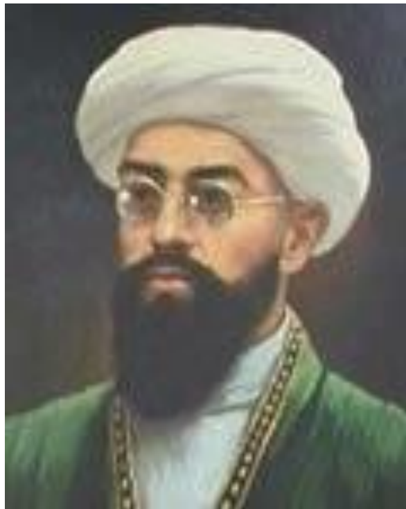
Махмудходжа Бехбуди (20 января 1875 г. – 25 марта 2019 г.)